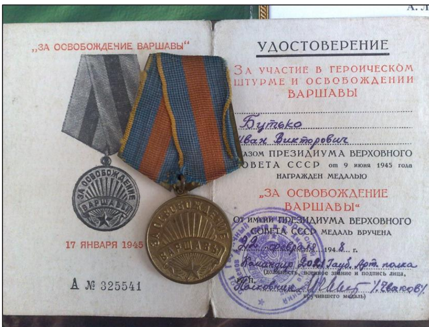
Фот. 4. Пасведчанне і медаль “За вызваленне Варшавы”

14 студзеня 1945 года Буцько І. В. атрымаў сразное асколачнае раненне мяккай тканкі левага бядра і быў адпраўлены на лячэнне ў армейскі палявы шпіталь № 5284. Пасля лячэння 13 лютага 1945 года Іван Віктаравіч накіраваны ручным кулямётчыкам ў 216-ы стралковы полк 79 стралковай дывізіі 1 Беларускага фронту, сія якога рухаліся на Берлін. Але 10 сакавіка, ужо на тэрыторыі Германіі, зноў апынуўся ў ваенным