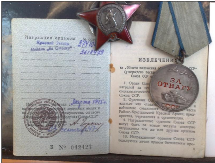
Фот. 3. Ордэн Чырвонай Зоркі і медаль “За Адвагу” За гэты час яны пераадолелі 7 умацаваных рубяжоў і 2 буйныя водныя перашкоды. У першы дзень наступлення войск 1 Беларускага фронту